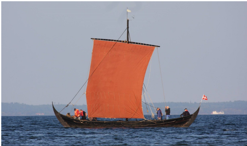
Forside med indholdsfortegnelse