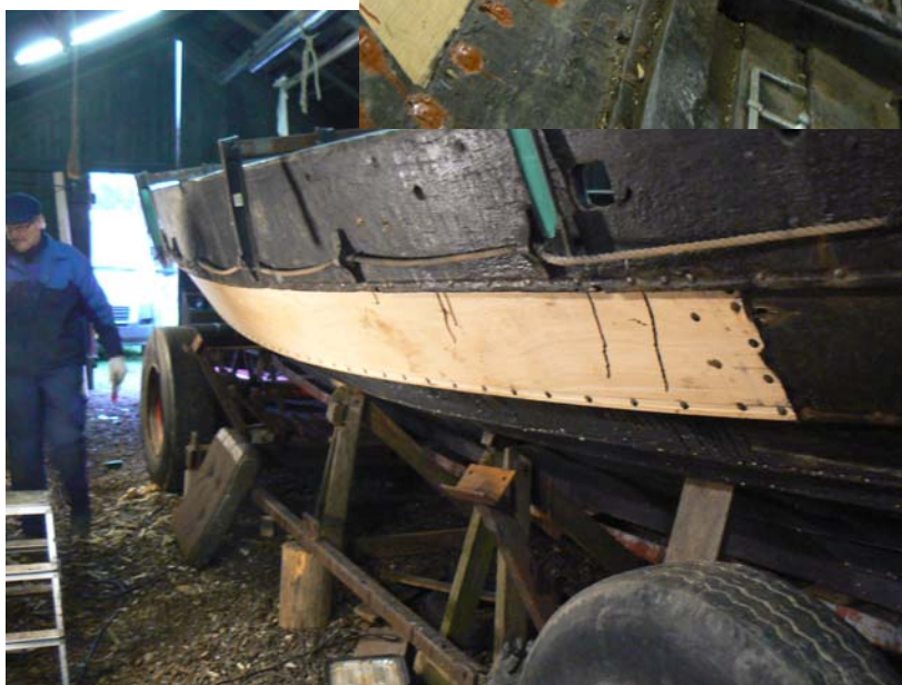
ny rdgang (gutterne på billedet er bådebyggerne fra Årøsund).