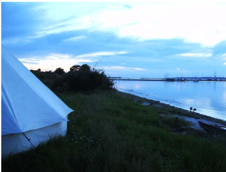
Lyø i godt vind

11.25 Rortov strammes. Ml. Svelmø og Knolden rebes og rebes ud.