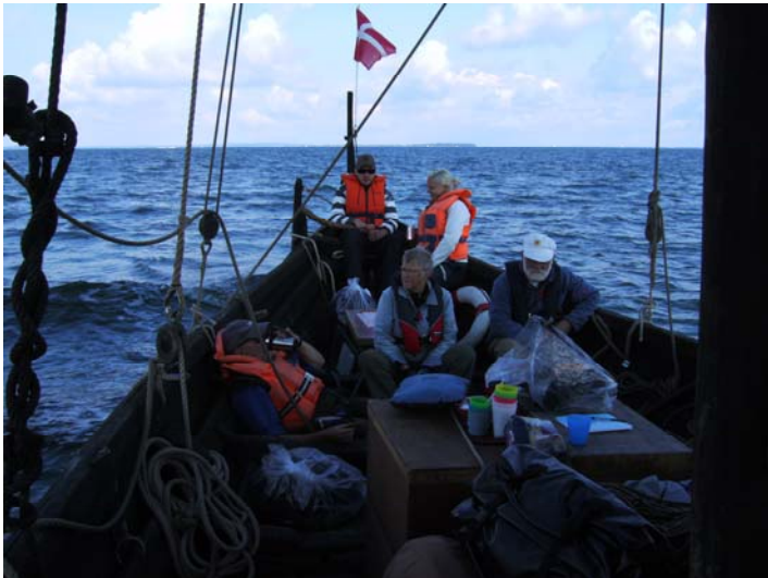
Af sted mod Svendborg

Middag på Jettes Diner. Splendid servering af brødebetyngt Jacob, som kommer med indpakning til de unge damer, og done-rer rødvinen. Overnatning i Kullinggade 4.c.1.th, i fælles lejlighed.